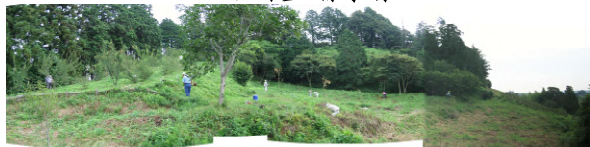
会員の奉仕による梅園整備が着実に進められています。