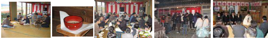
羊酒会 本年も盛大に開催されました。