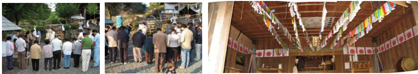
夏越し・年越しの大祓い式