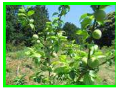
今年も見事に実をつけました