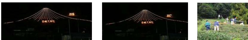
今年も年末年始イルミネーションが設置されました。